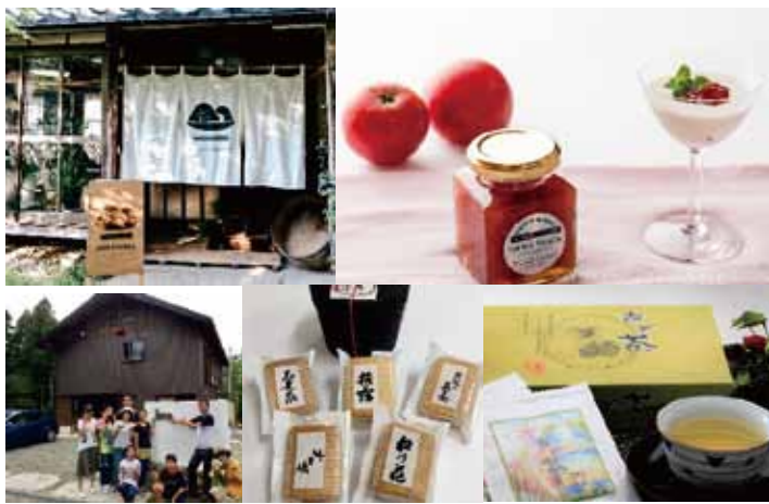
(左上) 最優秀賞「sato kitchen」みのり農園 (右上) 優秀賞「バニラ風味トマトのジャム」tomo'n (左下) 優秀賞「自然豊かな高島の魅力が体験できる宿泊施設～志我の里～」 (中央下) 発酵特別賞「高島五蔵の酒粕れーずんさんど」(淡)海群軒 (右下) 奨励賞「あど茶」(懶)福月