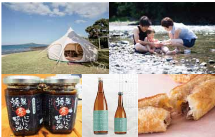
(左上) 最優秀賞「Okubiwako Marvelous Green」奥琵琶湖マキノグランドパークホテル (右上) 優秀賞「高島市の自然の素晴らしさをバックにした写真撮影のサービス」LIFETIME PHOTOGRAPHY (左下) 優秀賞「食べる燻製にんにく醤油」(南)岩佐商店 (中央下) 特別賞「萩乃露 特別純米 十水仕込 雨垂れ石を穿つ」(懶)福井弥平商店 (右下) 奨励賞「高島のおやつ『パイベえ』」(南)とも栄菓舗